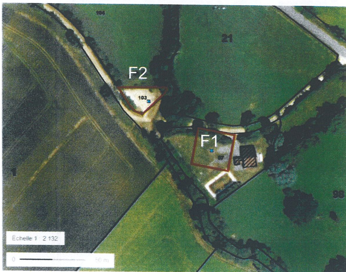
Figure 1 : PPI F1 et F2.

Le périmètre de protection immédiate du forage F1 est conservé (proposé le 24 Avril 1994 par S. BONNION, hydrogéologue agréé en matière d'hygiène publique pour le département de l'Yonne).