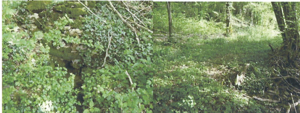
passage sous le chemin

L'eau apparaît sous un chemin forestier tracé en bordure du relief.