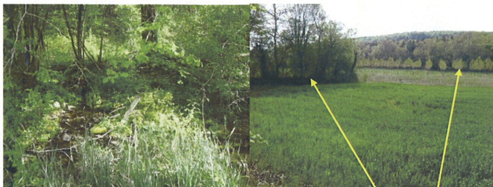
naissance du ru