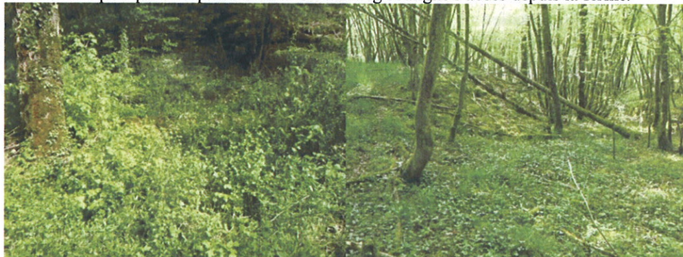
base du relief longé par le chemin

La base du relief est constituée par un banc calcaire d'environ 5 m marqué au sommet par une terrasse puis par une pente douce. Un thalweg souligne l'accès depuis la ferme.